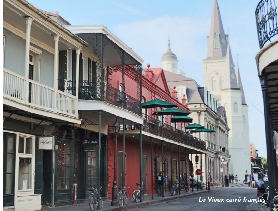
Le Vieux carré français