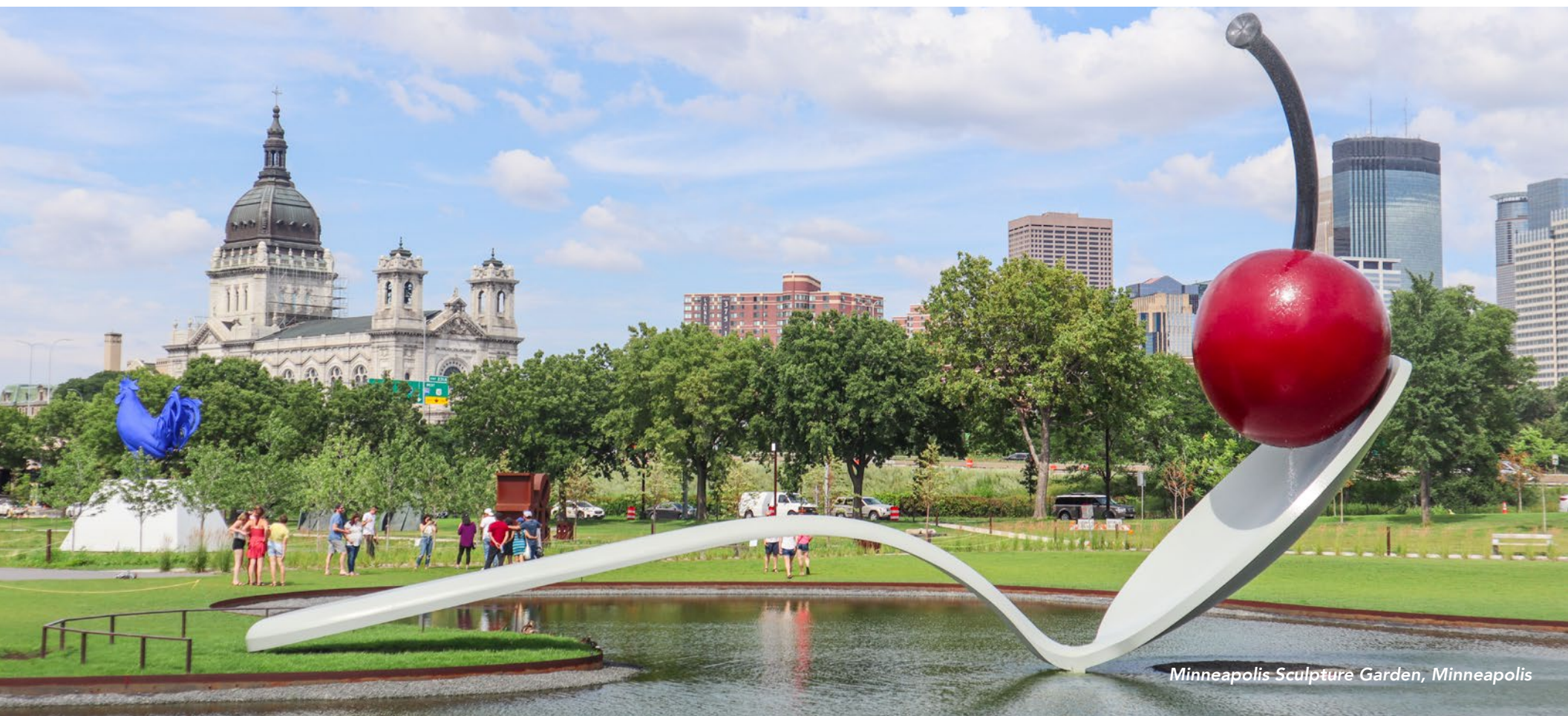
Minneapolis Sculpture Garden, Minneapolis

Hébergement : Minneapolis/Bloomington, Minnesota