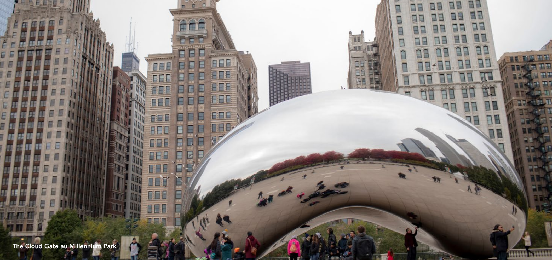
The Cloud Gate au Millennium Park